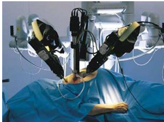
Figure 1: Robot chirurgical Da Vinci

Le thème du projet de cette année est la modélisation d'un scalpel monté sur un bras manipulateur robotisé. Le système mécatronique considéré sera utilisé pour effectuer des opérations chirurgicales de haute précision (inférieure à 0.5mm) sur des organes, il permet d'effectuer des opérations télécommandées à distance et peut fournir une aide au chirurgien.